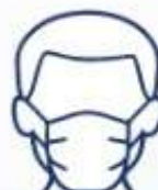
SENTIASA MEMAKAI PELITUP MUKA (FACE MASK)