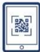
MEMBUAT PENGIMBASAN KOD QR MYSEJAHTERA