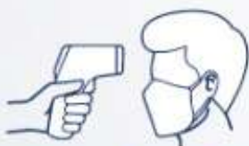
MENJALANI IMBASAN SUHU BADAN

CATATAN: SEMUA PELANGGAN ADALAH DINASIHATI AGAR MEMATUHI PROTOKOL KESIHATAN UMUM YANG TELAH DITETAPKAN DALAM USAHA MEMUTUSKAN PENULARAN WABAK COVID-19.